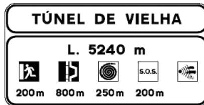
CARTEL CARRETERA CONVENCIONAL 1A