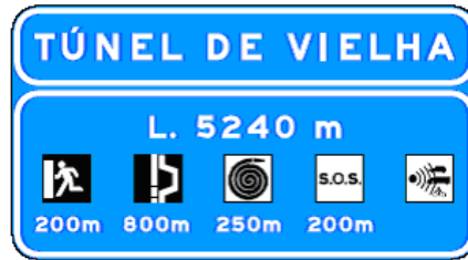
CARTEL AUTOPISTA 1A

La longitud se indicará ya sea en el panel o en otro panel H2. Asimismo se indicarán las instalaciones de seguridad del túnel y las obligaciones específicas de circulación dentro del mismo (velocidad máxima, separación entre vehículos, etc.) en la forma siguiente: