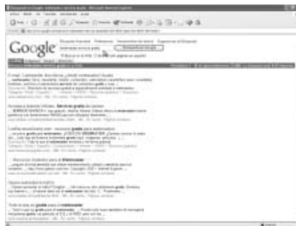
Figura 2. Los buscadores de Internet, como GOOGLE también son un buen sistema para localizar servicios gratis para los webmasters

Quiero terminar esta introducción aclarando que no hay nada de mágico ni especial en solicitar y utilizar alguno de estos servicios, pues lo que ocurre en realidad, es que nuestra página web se va ampliando con secciones que están guardadas en otras ubicaciones distintas al lugar donde se sitúan nuestros códigos HTML, aunque el proceso funciona de forma que las visitas a nuestra página web no se percatan de los saltos que realizan en su recorrido. Lo único que puede distinguir el visitante en algunos casos es que el diseño del servicio no guarda relación con el del resto de la página y la publicidad que incorpora normalmente. También puede pasar que nuestra página web funcione sin problemas y el servicio no lo haga, ya que son servidores distintos, pero algún riesgo debemos correr por utilizar servicios de forma gratuita.