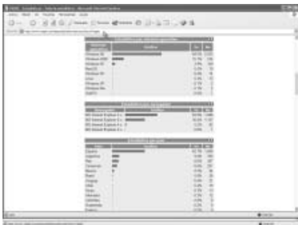
Figura 4. YASPE también es una buena opción para controlar datos estadísticos de las visitas de nuestra página web

En esta versión de Formularios 1, es necesario un pequeño conocimiento de HTML, ya que el código que nos muestran hay que adaptarlo a nuestras necesidades. Los usuarios que no deseen aprender HTML, pueden generar automáticamente el código de su formulario con cualquier herramienta de autor (FrontPage, Composer, etc.) y sustituir solo el código marcado en "rojo".