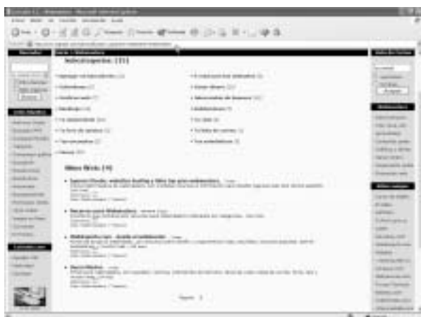
Figura 1. La sección WEBMASTER de LOGRATIS.COM incluye un buen número de servicios gratuitos para incluir en nuestras páginas web

En este artículo se van a mencionar algunas de las soluciones más fáciles que pueden ser utilizadas por la mayoría de los diseñadores web, con la particularidad de que todas ellas son gratuitas y se instalan sin conocimientos especiales. Es suficiente con disponer de conocimientos básicos sobre HTML y de un espacio web donde publicar nuestros documentos para tener acceso a dichas utilidades.