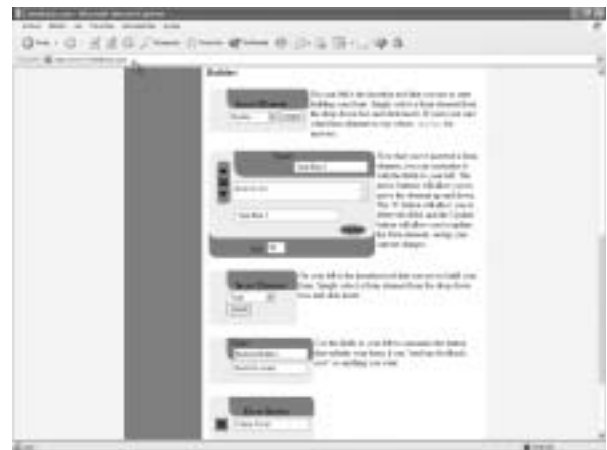
Figura 7. Feedback hace posible la creación de nuestro formulario web directamente desde un generador on-line.