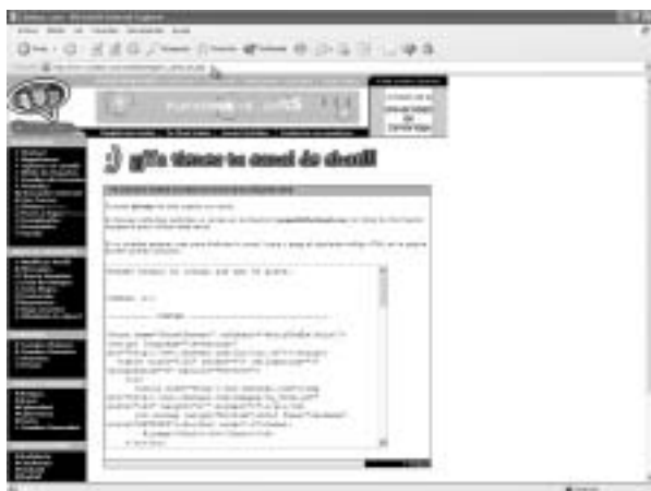
Figura 8. Chatear.com nos proporciona inmediateamente el código que hay que insertar para conseguir un chat on-line.

En un lugar donde los idiomas proliferan, nada como implementar un servicio de traducción.