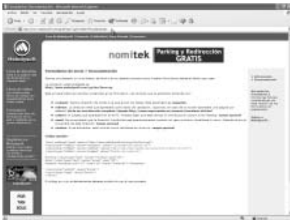
Figura 6. MelodySoft ofrece, entre otros servicios, la posibilidad de añadir un formulario a nuestra página web.