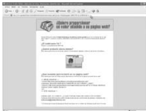
Figura 12. La empresa de antivirus Panda nos permite incluir en nuestra página web un enlace a su servicio de antivirus on-line.

los cambios son mucho más rápidos, y en consecuencia, no es de extrañar que alguno de los servicios comentados en este artículo, en el momento de su publicación, puede haber sido retirado, ampliado, reducido,..., o sufrido alguna otra modificación.