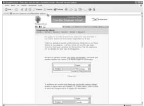
Figura 11. Con Foreign Word podemos incluir un traductor on-line en nuestra página web.

También quiero comentar que muchas de las direcciones web que se han comentado incluyen más de un servicio, por lo que deben ser analizadas con el suficiente detalle como para que no se nos escape nada importante.