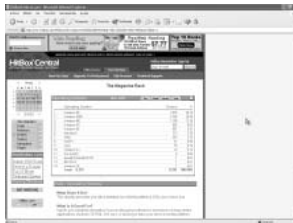
Figura 5. HITBOX CENTRAL es una de las mejores opciones de control de datos de visitas que podemos encontrar en Internet.

Si ya tenemos nuestro formulario, podemos insertar un foro de discusión.