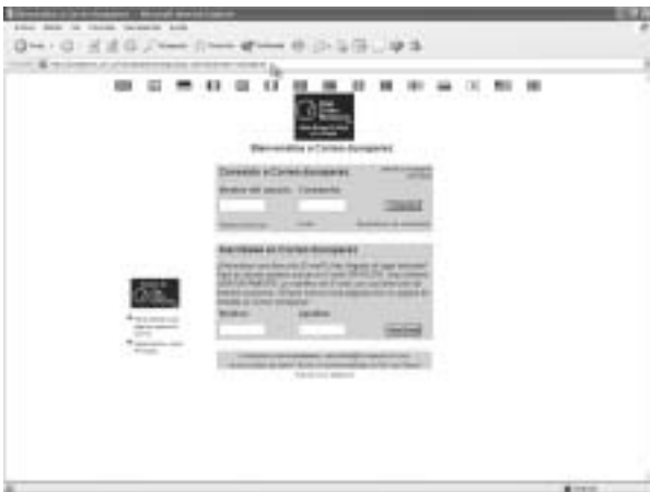
Figura 10. Zap Zone Network (ZZN) es uno de los servicios que nos permiten incluir un web mail propio en nuestra página web.

En realidad, como la mayoría de las empresas de antivirus mantienen sistemas de chequeo on-line, la única condición para ofrecérselos a nuestras visitas es añadir un enlace en nuestra página que señale a la dirección completa del servicio deseado.