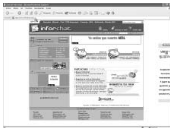
Figura 9. InforChat es otra de las opciones recomendadas si deseamos incluir un servicio de chat en nuestra página web.

Internet también puede ser peligroso, así que debemos tener muy en cuenta los servicios antivirus.