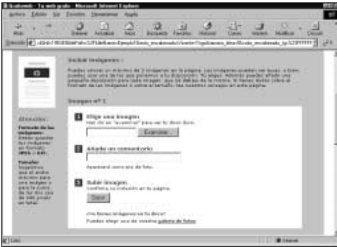
Figura 19. Sus imágenes deben estar en formato Jpeg o Gif