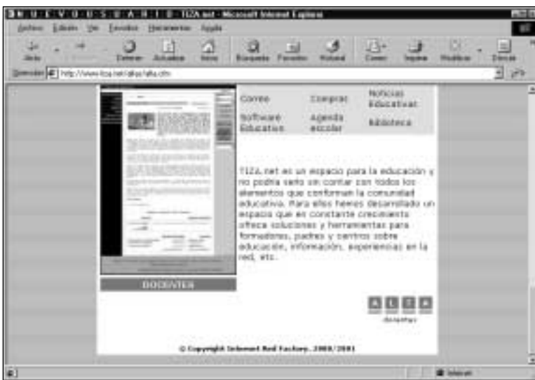
Figura 9. Supongo que docentes es la opción más apropiada, ¿no?

Se abrirá una nueva página donde hay que seleccionar la opción en que mejor encajamos: primaria, secundaria o docentes. En nuestro caso, parece evidente que las dos primeras opciones no son muy adecuadas, así que nos quedaremos con docentes. Por tanto, haga clic sobre el enlace ALTA de la figura 9.