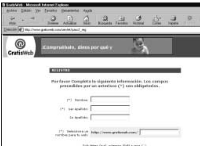
Figura 14. Comienza el proceso de registro