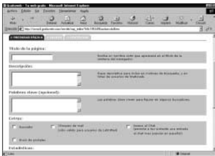
Figura 17. Primer paso con el asistente

http://www.gratisweb.com/su_nombre/titulo_de_su_página.html