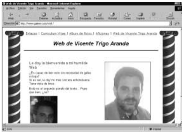
Figura 7. Web diseñada online en Galeón

Para que compruebe que este artículo está escrito especialmente para ACTA y no se trata de un mero refrito de mi libro antedicho, seguidamente le voy a explicar cómo crear páginas Web online en otros dos servidores: TIZA.net y GratisWeb. ¡Confío en que pase un rato entretenido!