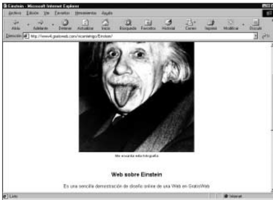
Figura 23. ¿Le gustó el diseño online en GratiWeb?

Tras finalizar el diseño de cada página, puede ver su creación ya publicada (figura 23), aunque tendrá que retroceder al asistente para continuar con la elaboración de su Web... y, si no tiene suficiente con diez páginas, puede crear una nueva Web y establecer algún enlace entre ambas.