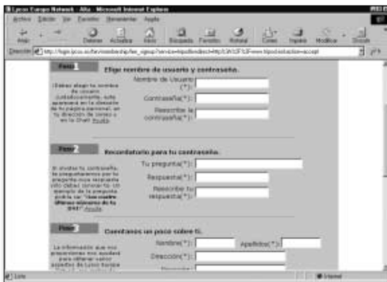
Figura 4. Formulario a cumplimentar en Tripod