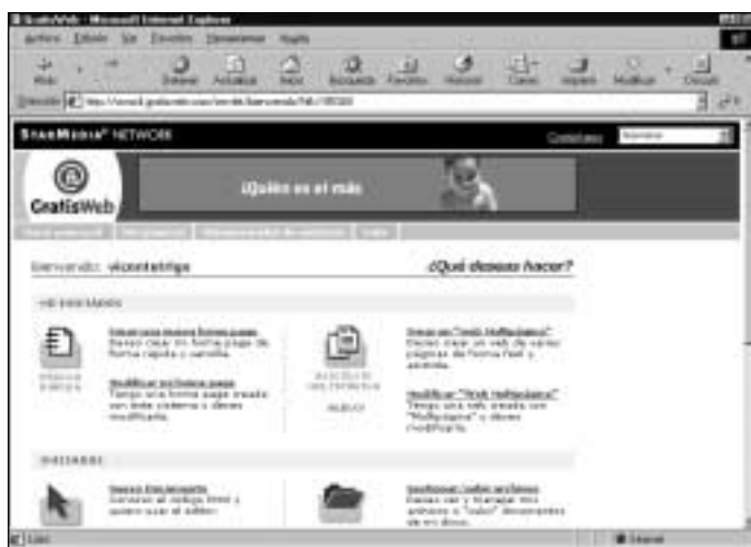
Figura 16. Dos modelos de diseño online