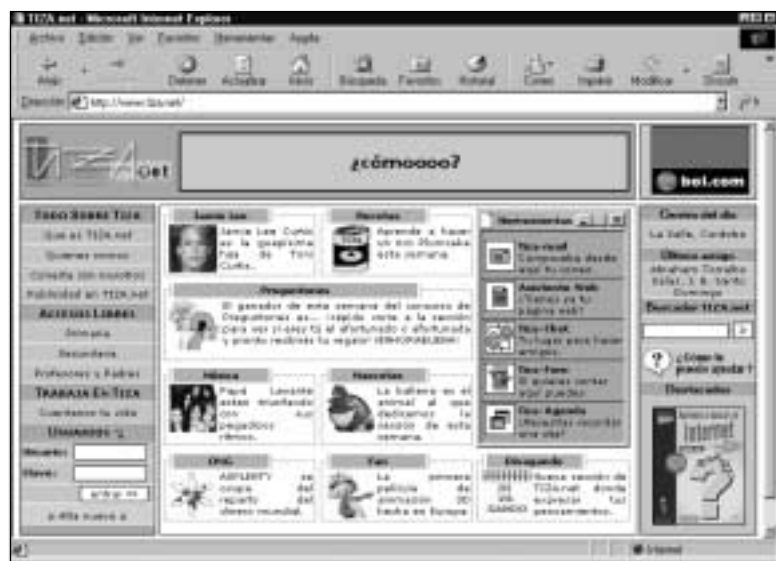
Figura 8. Página de entrada a TIZA.net