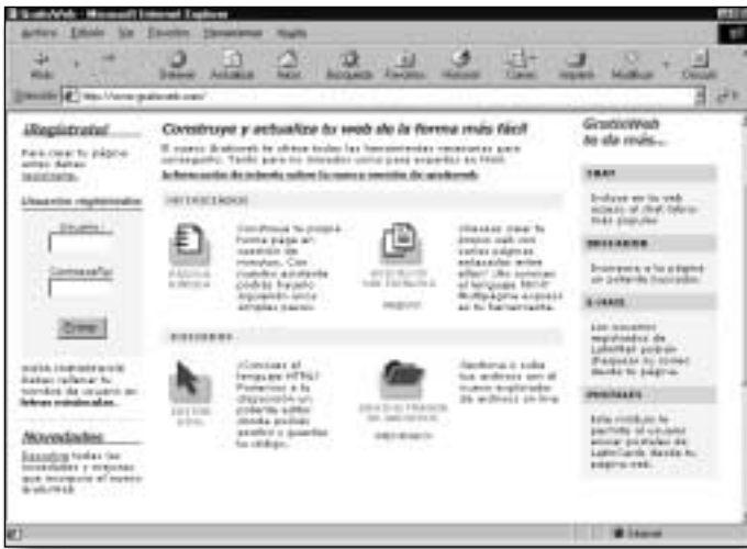
Figura 13. Página de entrada a GratisWeb