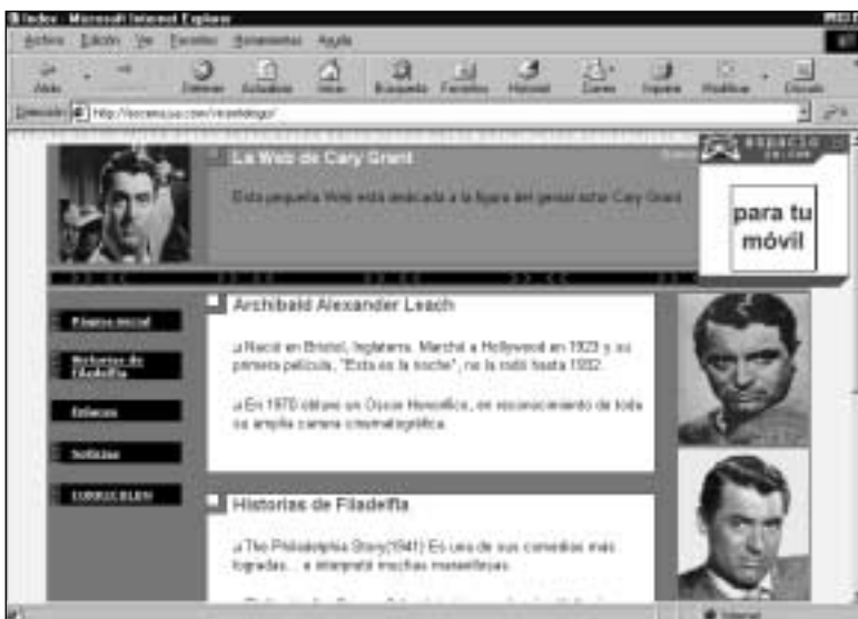
Figura 1. Página Web diseñada online en Ya.com