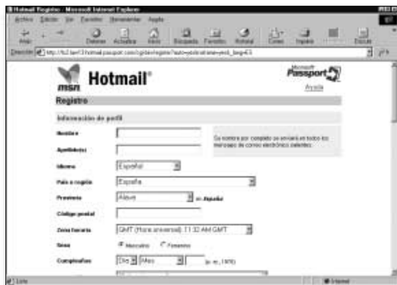
Figura 6. Formulario que debe cumplimentar para registrarse en Hotmail

Seguidamente le voy a explicar cómo debe registrarse en Hotmail, que le ofrece correo en la modalidad Webmail; de hecho, fue el primer servidor en ofrecer este servicio. ¿Y qué es eso de Webmail?