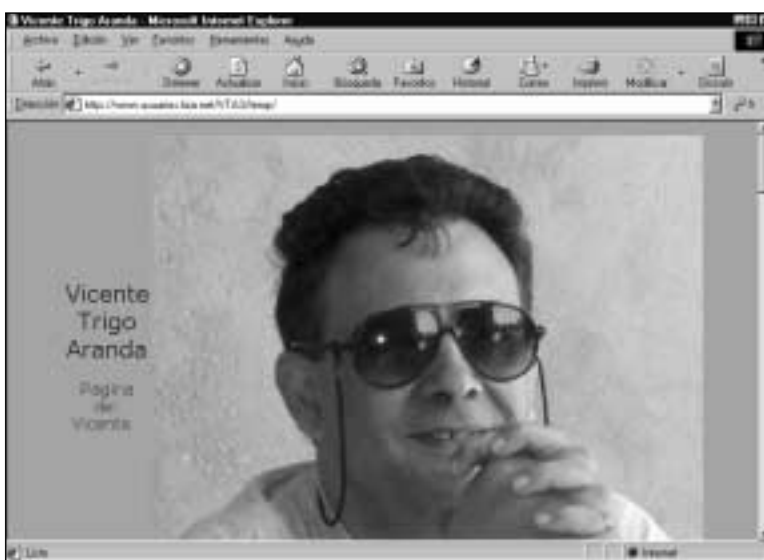
Figura 12. ¡Ya está la página en Internet!

¿Está ahí? Si es así, perfecto; sin embargo, en las diversas pruebas que he realizado nunca he conseguido