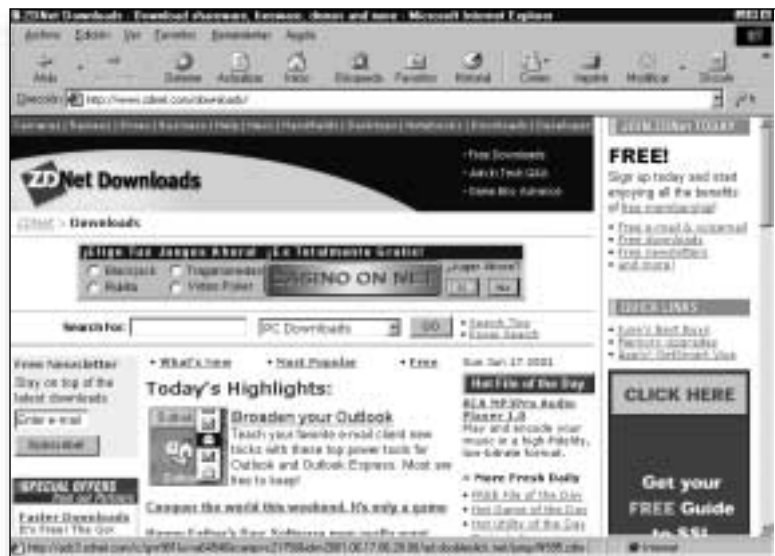
Figura 2. Uno de los mejores sitios de Internet para descargar software

Sin embargo, es posible que tenga instalado en su ordenador Microsoft Photo Editor, ya que se incluía en la versión antigua de Office. Si es así, sólo tiene que abrir su imagen desde él y, en el menú Archivo, ejecutar Guardar como. Se abrirá así el típico cuadro de diálogo de la figura 3, donde deberá seleccionar el tipo de