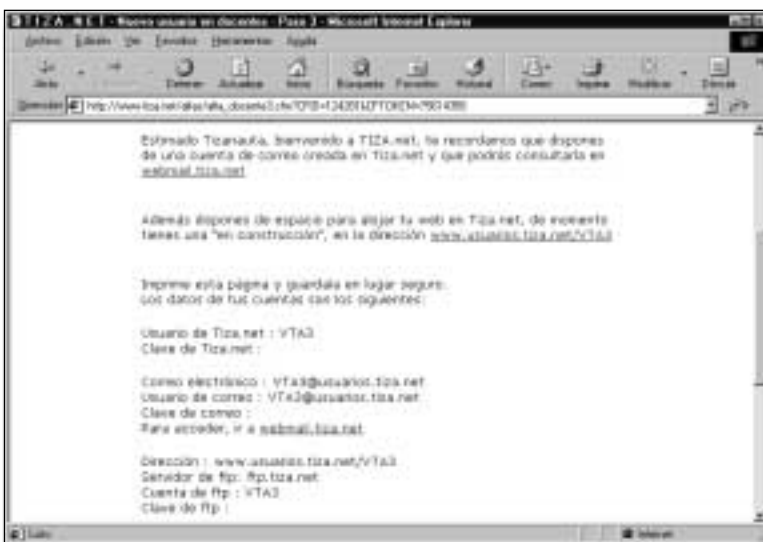
Figura 10. He suprimido la contraseña

Pasará a una nueva página donde tiene que escribir su nombre (el cibernético, no el real) y su contraseña; como ésta se muestra en pantalla con asteriscos, debe volver a teclearla para evitar errores. Al pulsar el botón Enviar se le presentará un formulario donde tiene que cumplimentar una serie de campos. Como ya le he indicado anteriormente, es decisión suya dar sus datos reales... yo nunca lo hago.