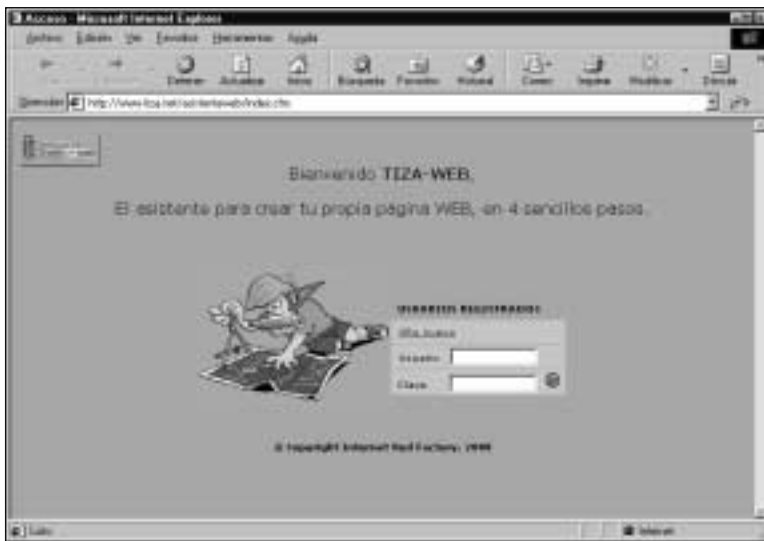
Figura 11. Comienza el diseño online