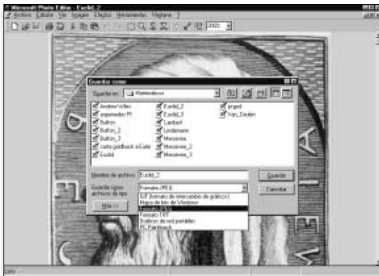
Figura 3. Elija formato Jpeg o Gif

formato que tendrá su nuevo archivo, desplegando la lista correspondiente.