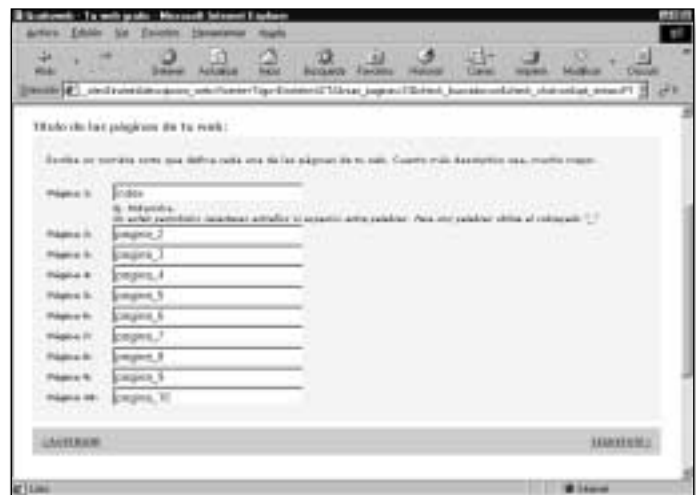
Figura 21. ¿Quiere cambiar el nombre de las páginas de su Web?

Al pasar a la siguiente página del asistente, comienza el diseño propiamente dicho, con la selección de colores. Lo habitual es dar una cierta homogeneidad visual a la Web y, por ello, es conveniente que todas sus páginas tengan igual combinación de colores. Si opina lo mismo, pulse el botón Aplicar Diseño en todas las páginas .