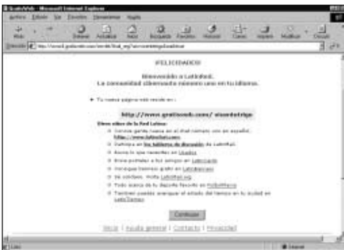
Figura 15. Mensaje de bienvenida, junto con la dirección de su Web

Después, en una nueva página, debe introducir su contraseña, por dos veces, para evitar errores. También debe escribir una frase que le permita recordar la contraseña en caso de olvido.