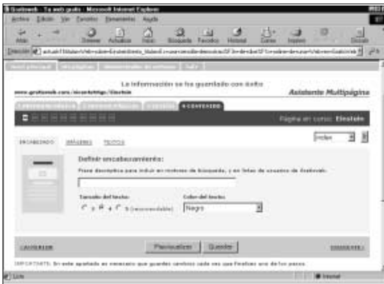
Figura 22. Creando las páginas del sitio Web

En la siguiente página (figura 22) puede configurar cada una de las página de su Web tal y como lo ha hecho para una página individual. Pulse los enlaces ENCABEZADO , IMÁGENES y TEXTOS para establecer los elementos que conformarán el contenido de su página. Para ir a otra página de su Web, despliegue el listado de las existentes, seleccione la deseada y pulse Ir .