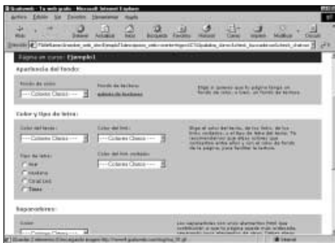
Figura 18. Elijiendo colores

http://www.gratisweb.com/su_nombre/titulo_de_su_Web