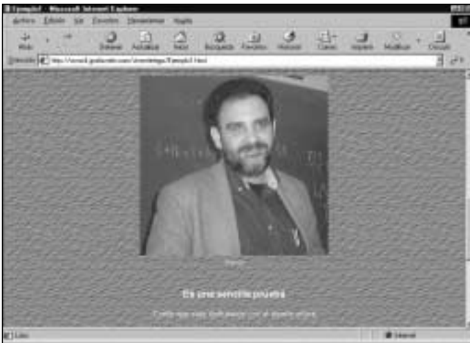
Figura 20. Mi página recién creada online en GratisWeb

En la siguiente página (figura 21) puede cambiar el nombre que se asigna por defecto a las páginas de su Web (recuerde que no son válidas las vocales acentuadas). Si lo desea escriba los nuevos nombres, pero es aconsejable que no modifique el que se asigna por defecto a la página de entrada a su Web (index). De esta forma, para ir a su Web sólo habrá que teclear la dirección citada anteriormente; en cambio, si modifica el nombre de la página 1, la dirección de su Web será algo más larga: