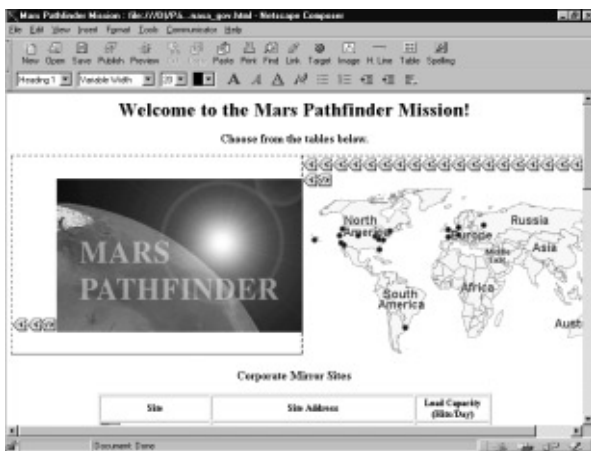
Figura 6. Editando una página con Composer.

Composer nos permite crear nuestras propias páginas con gran sencillez y aspecto profesional sin apenas conocer el código HTML. También permite capturar una página de la Red con todos sus elementos y modificarla a nuestro gusto. La forma de operar es insertando elementos en la página editada y modificando sus propiedades, todo ello mediante las herramientas de que dispone el programa. Podemos insertar texto con diferentes formatos, fuentes, tamaños y colores, imágenes con o sin marco, tablas con el número que deseemos de filas y columnas, enlaces a otras páginas o direcciones de correo, fondos de colores o personalizados, líneas de diversos grosores y tipos, etc. También es posible desde Composer previsualizar la página editada en Navigator para comprobar el aspecto que tendrá en la Red, publicar las páginas que diseñemos en la Red con todos los elementos que incluyen automáticamente y conservando los enlaces, chequear ortográficamente el texto del documento (opción actualmente disponible sólo en inglés), etc.