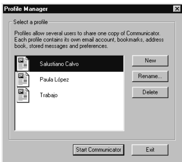
Figura 8. Vista del gestor de perfiles de usuario.

files independientes con distintos valores de configuración, cuentas de correo, libretas de direcciones preferidas de la Red, agendas, etc. Esto resulta muy útil, ya que cada perfil no interfiere en absoluto en los demás, lo que, en efecto, es como disponer de varios programas a la vez. Tanto si el equipo en que esté instalado Communicator va a ser utilizado por varias personas como si deseamos poder acceder a varias configuraciones diferentes, esta herramienta nos resultará especialmente útil, ya que evita el engorro de cambiar los datos cada vez y organizar la información si la deseamos separar. Para crear un nuevo perfil tendremos que rellenar los datos necesarios, como el nombre del mismo, el del usuario, los servidores de correo y news, etc. Una vez creado, la ejecución de Communicator se realizará seleccionando el perfil deseado.