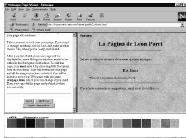
Figura 10. El asistente de creación de páginas.

Netscape ha creado un nuevo servicio que asiste al usuario, de un modo sencillo y totalmente guiado, en la creación de páginas web simples sin necesidad de conocer el código HTML, ni tan siquiera el manejo de Composer. Este servicio está en la Red, por lo que será necesario conectarse a ella para utilizarlo. Paso a paso, introduciremos los elementos de la página, en la que podremos incluir el título de la misma, nuestro nombre, un texto de información, enlaces, el color y la textura del fondo, etc.