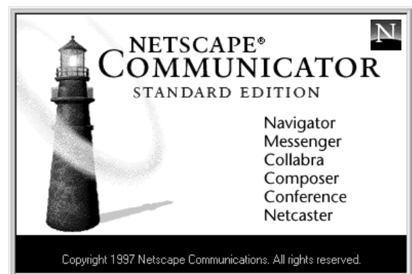
Figura 1. El faro de Communicator guía a los navegantes de Internet.

La ofensiva por parte de Netscape es Communicator, compuesto por un extenso paquete de programas integrados que supone, respecto a