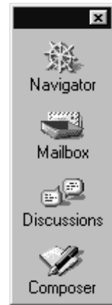
Figura 2. La barra flotante maximizada.

tante que, siempre en primer plano (ya esté maximizada o minimizada), nos permite abrir sesiones de los programas principales de la suite con tan sólo pulsar un botón.