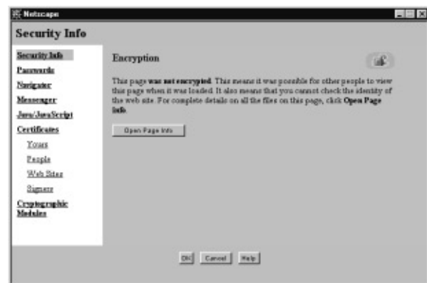
Figura 7. Ventana principal de las opciones de seguridad.

correo y news están o no encriptados, y en el caso de los segundos, también si disponen de firma electrónica, lo que autentifica su procedencia. Mediante la clave de acceso evitaremos el uso del programa por parte de otras personas, ya que se solicitará al ejecutar el programa de varias maneras (sólo una vez, cada cierto tiempo, etc.). Communicator también nos avisará al producirse ciertas incidencias, como acceder a un sitio web encriptado, al abandonarlo, cuando enviemos información no segura a la Red, etc.