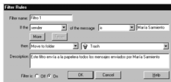
Figura 5. Definición de un filtro de correo.

Los filtros de mensajes, que pueden combinarse y aplicarse en el orden deseado, hacen que podamos realizar ciertas operaciones con los mensajes recibidos antes de leerlos. De este modo podremos borrar ciertos mensajes al recibirlos, marcar como leídos otros, moverlos de carpeta automáticamente, etc., lo que es especialmente útil cuando tengamos gran volumen de correo.