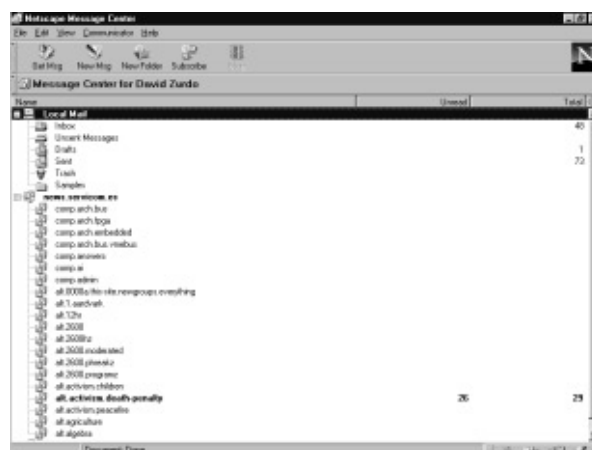
Figura 4. La ventana general de Message Center.

desde aquí accederemos a las ventanas que gestionan las carpetas de correo y los grupos de news. En los mensajes, Communicator incorpora el uso del formato HTML, por lo que podremos componerlos con los mismos elementos de las páginas web, con texto de diferentes formatos, imágenes, fondos, enlaces, iconos animados, etc. La agenda (Address Book) permite incluir usuarios con su tarjeta de datos muy completa y listas de usuarios para realizar mailings. También podemos confeccionar nuestra tarjeta personal y asociarla a nuestros mensajes, así como enviar adheridos ficheros de cualquier formato y páginas web.