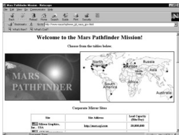
Figura 3. Página web visualizada con Navigator.

funcional, e incluye las más amplias posibilidades de navegación en la Red. De entrada, llama la atención la nueva herramienta que nos permite automatizar tareas como el chequeo del buzón de correo electrónico, la descarga de mensajes de los grupos de news o el envío de los mensajes pendientes, a la hora de conectar o desconectar con la Red (que puede ejecutarse desde otras sesiones). También se ha mejorado la gestión de las listas de direcciones favoritas (Bookmarks), ya que basta con arrastrar desde el icono del cuadro de localización (donde se escribe la dirección de la página) hasta el botón Bookmarks para añadir la dirección a la lista de preferidas. Por otro lado, existe una barra de herramientas personales en la que podemos incorporar botones que nos lleven a una dirección concreta o que desplieguen listas de las mismas. En cuanto a la visualización de las páginas visitadas, Navigator cuenta con posibilidades de variar el tamaño de las fuentes de la página, su juego de caracteres, mostrar las imágenes o el código fuente, detener las animaciones, etc.