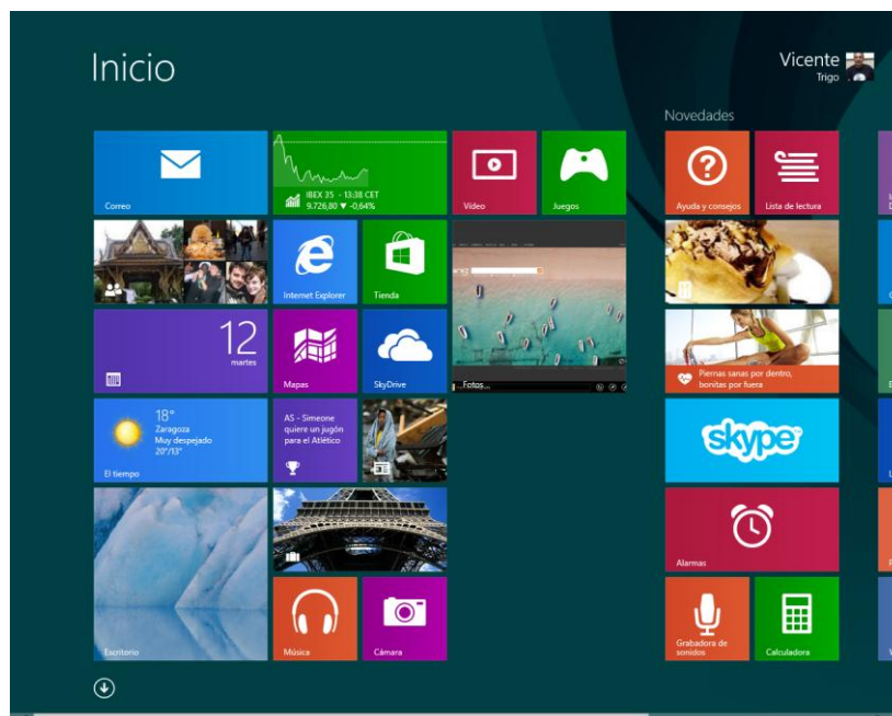
Figura 1. Pantalla Inicio de Windows 8.1.

En el lateral derecho de la figura 1 observamos varias de las nuevas aplicaciones incluidas en Windows 8.1 y, como algunas son interesantes, vamos a comentarlas brevemente.